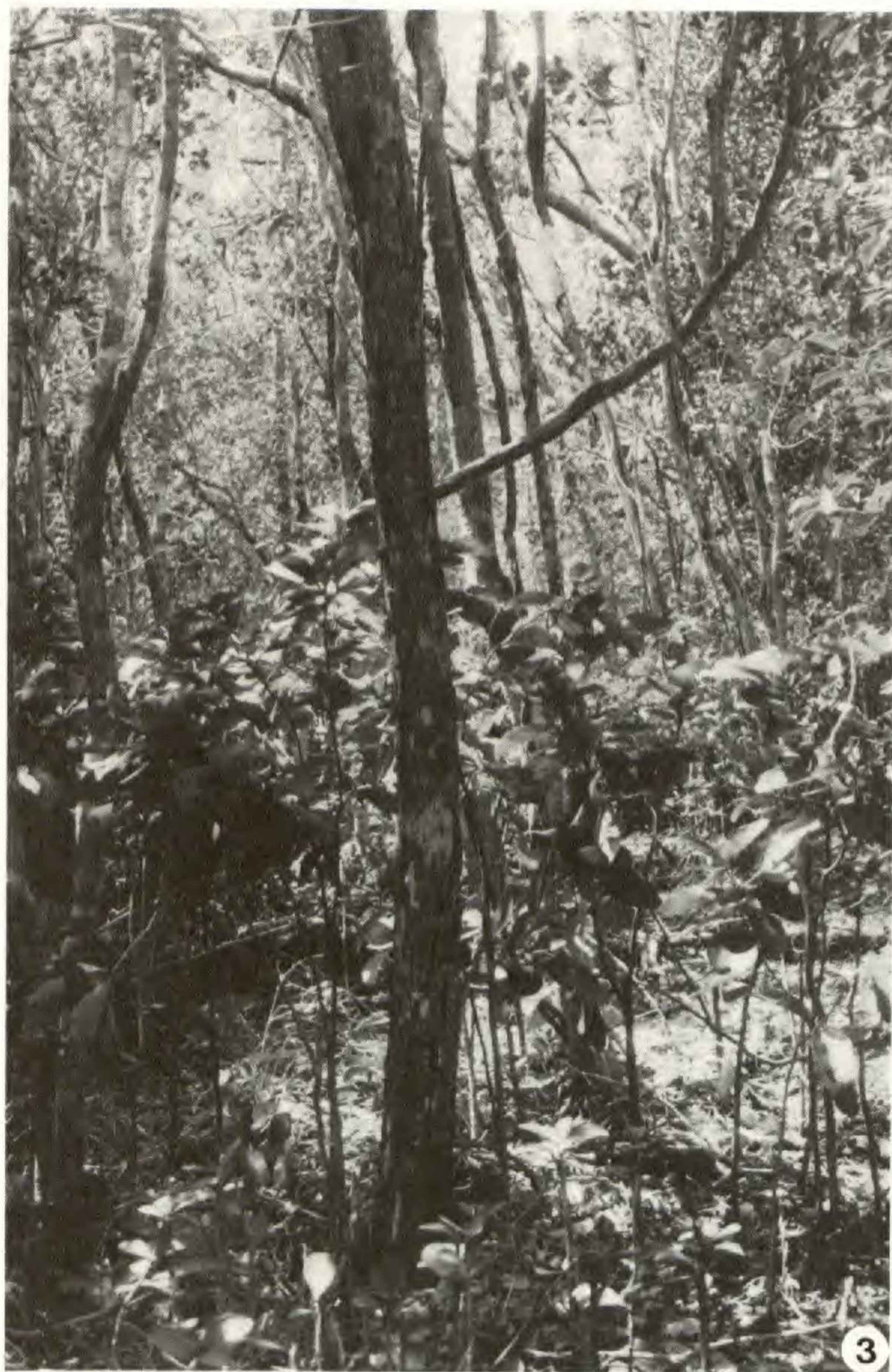
Fig. 2. — 1, reste de forêt sclérophylle sur le versant ouest (Païta : Mt. Maa, 200 m) ; 2, forêt sclérophylle à Terminalia cherrieri et Bothriochloa pertusa , 5 ans après défrichement (Baupré) ; 3, sous-bois de forêt sclérophylle à Phyllanthus unifolius (Pindaï).